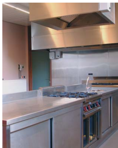
de kook- en leskeuken