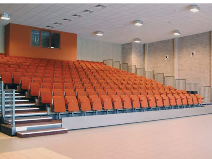
de tribune in de polyvalente zaal